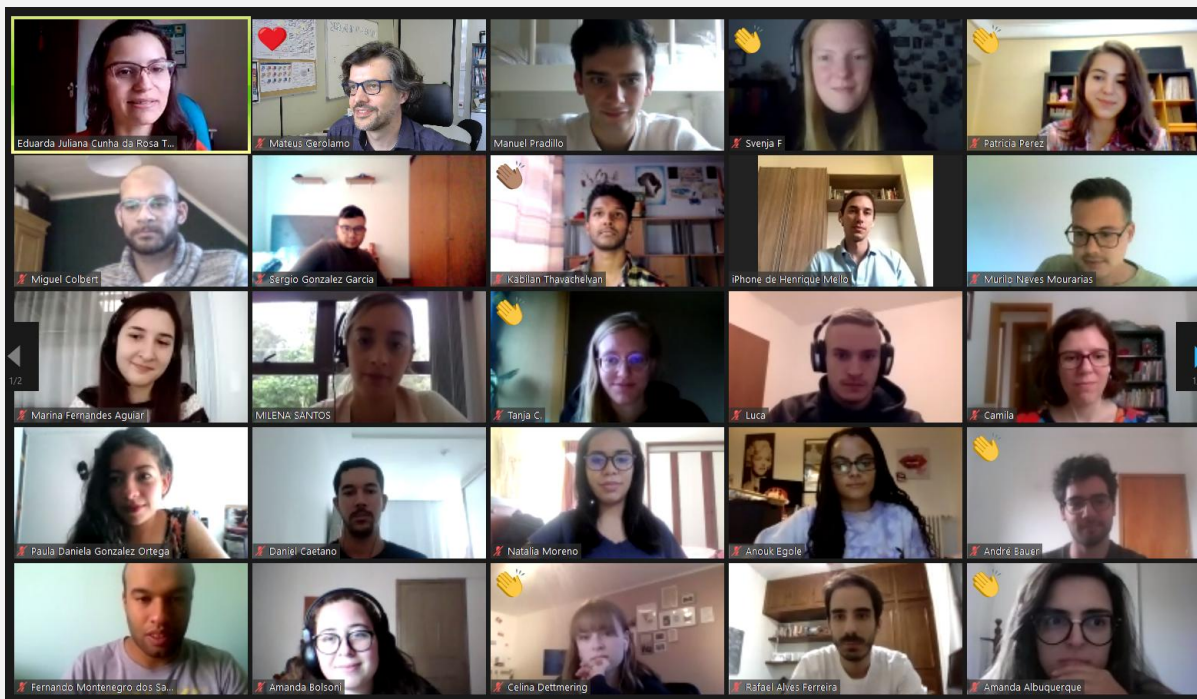
Foto: parte da turma 2020 na última aula do curso.